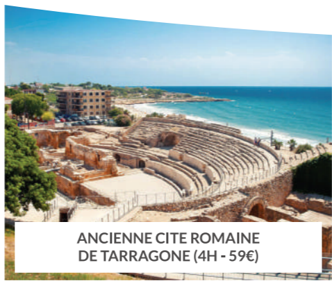
ANCIENNE CITE ROMAINE DE TARRAGONE (4H - 59€)