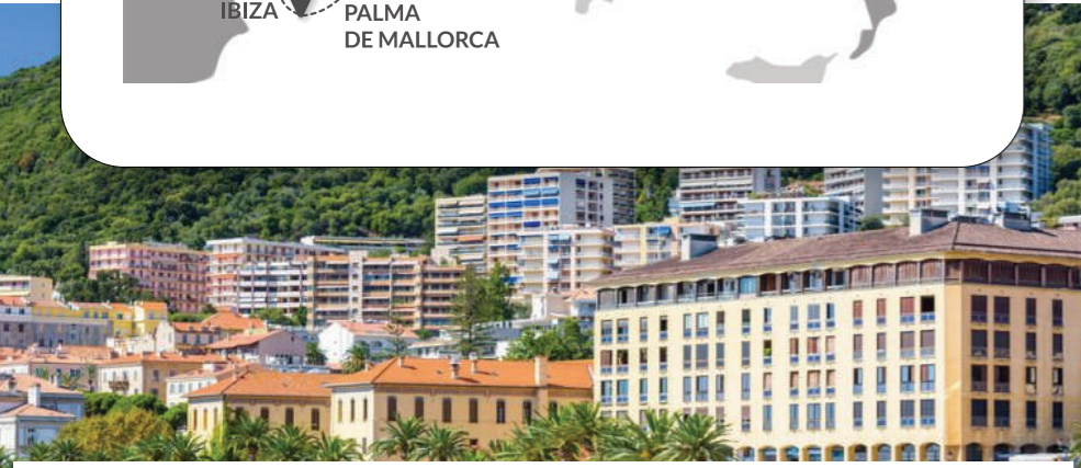
VISITE PANORAMIQUE ET GASTRONOMIQUE D'AJACCIO (3H30 - 50€)