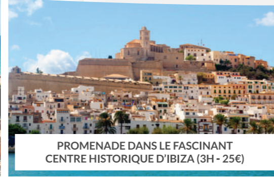
PROMENADE DANS LE FASCINANT CENTRE HISTORIQUE D'IBIZA (3H - 25€)