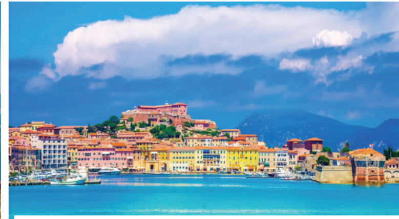
PROMENADE A LA DECOUVERTE DE PORTOFERRAIO ET DE PORTO AZZURRO (4H - 60€)