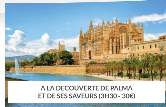
A LA DECOUVERTE DE PALMA ET DE SES SAVEURS (3H30 - 30€)