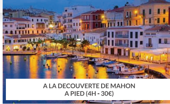
A LA DECOUVERTE DE MAHON A PIED (4H - 30€)