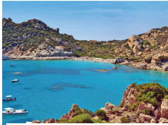
A LA DECOUVERTE DE LA SARDAIGNE TERRE DES NURAGHES (4H - 60€)