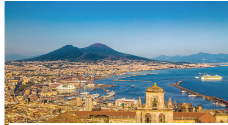
SITE ARCHEOLOGIQUE DE POMPEI (4H - 65€)