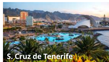
S. Cruz de Tenerife