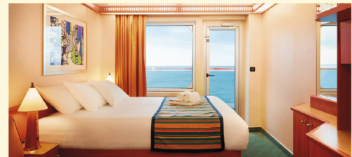
Cabine Balcon Vue Mer